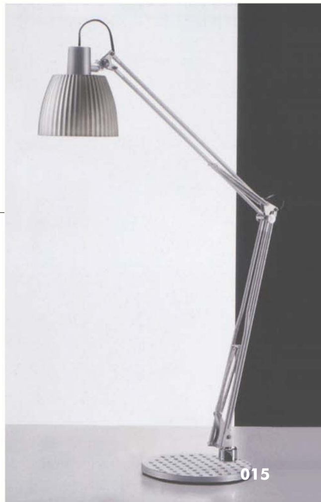
Table lamp for incandescent bulbs and compact fluorescent 230V-60W max 12W, maximum length of the bulbs, socket and including 110 mm. Reflector polymer translucent white, upper support polymer housing. Arm in painted steel, spring steel and come in chrome metal. Equipped with chrome-plated steel clamp for attachment to the tabletop. (EXCLUDING LAMP). Base for lamp Ø 22 cm in painted steel.

Lampada da tavolo per lampadine ad incandescenza 230V-60W o fluorescenti compatte max 12W, lunghezza massima delle lampadine, attacco compreso, 110 mm. Riflettore in tecnopolimero traslucido bianco, supporto superiore in tecnopolimero. Braccio in acciaio verniciato, molle in acciaio e giunti in metallo cromato. Dotata di morsetto in acciaio cromato per il fissaggio al piano del tavolo. (ESCLUSA LAMPADINA). Base per lampada Ø cm 22 in acciaio verniciato.